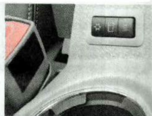
Der Becherhalter kühlt auf +2 °C runter oder heizt auf +60 °C auf.