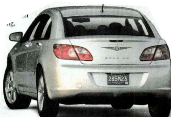
Elegantes Heck mit tief nach unten gezogener Dachlinie.